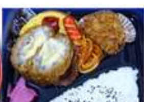
チーズハンバーグ 500円