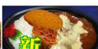
旭川ハヤシライス 500円