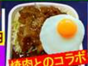
焼肉とのコラボ 月見カレー 500円