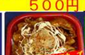
人気の焼肉に辛しマヨネーズ 辛マヨ焼肉丼 500円