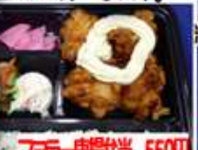
マヨラー唐揚げ当 550円