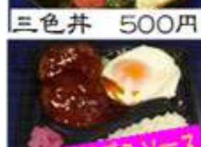
目玉焼ハンバーグ 500円