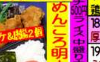
めんころ明太弁当 500円